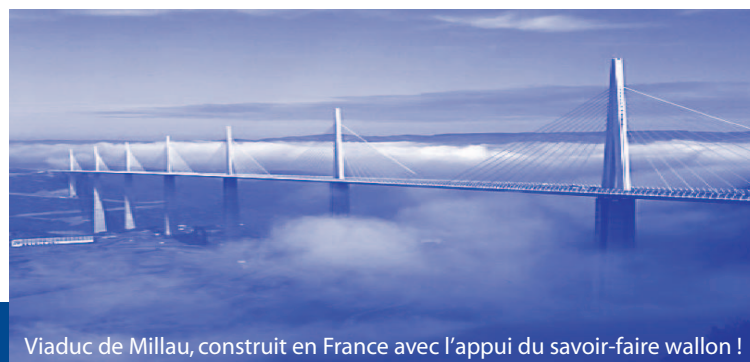
Viaduc de Millau, construit en France avec l'appui du savoir-faire wallon !